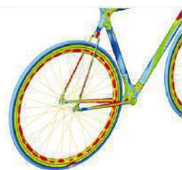
自転車のフレームにかかる応力を計算する (構造解析)