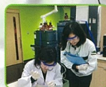
インターン実施風景